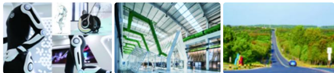
/可穿戴便携式外骨骼概念设计/

近五年(2019-2023)到账科研经费2.37亿,获立国家重点研发计划课题5项,国家自科/社科基金32项;获立省部级以上课题80余项;教师以第一或通讯作者身份发表高水平论文608篇,其《SCIENCE》Letter文章6篇;以第一作者获省部级科研奖8项;获省部级及以上批示或采纳咨询报告28篇;获IFLA奖、红点奖、全国优秀勘察设计奖等国际及国家级设计奖71项。