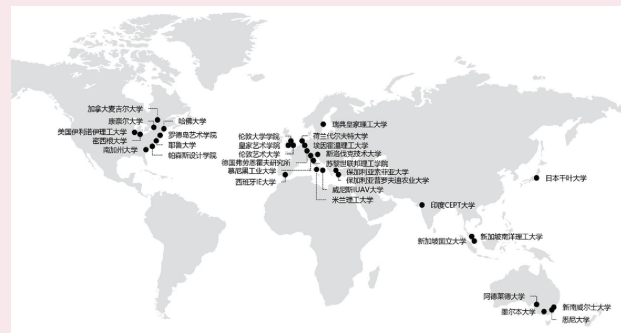
/学院国际合作拓展图/

2023年,受中华人民共和国文化和旅游部委托,学院团队执展作为国际上规模最大、最具影响力的艺术盛事之一的第十八届威尼斯国际建筑及年展中国国家馆,弘扬中国智慧,深化文明交流互鉴。